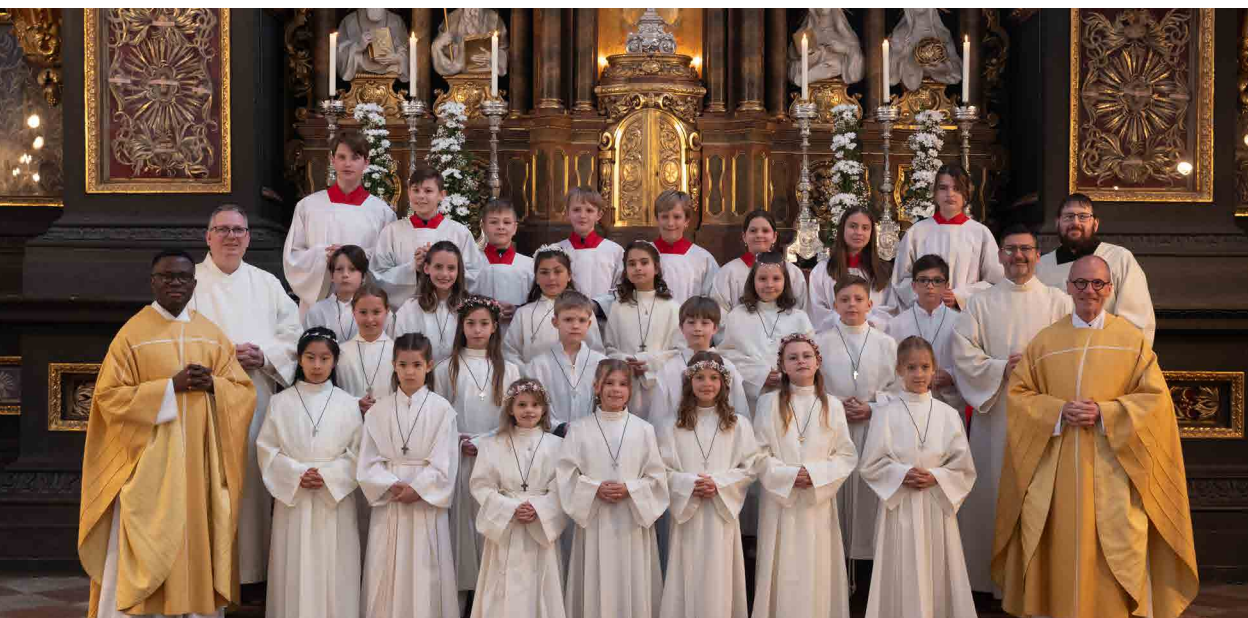
Erstkommunion am 26. April in St. Emmeram